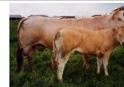
gamine et son veau