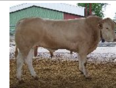
Son fils par TOKAPI en fin de CI