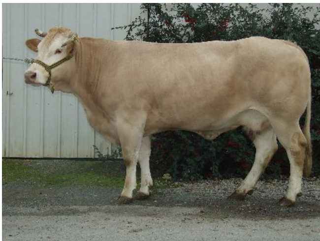
Naisseur: EARL LES PATUREAUX Propriétaire: EARL LES PATUREAUX 79270 EPANNES