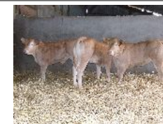
3 veaux nés de l'accouplement AZALEE*ARAMIS