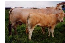
gamine et son veau