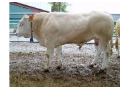
BONUS TULA/OURAGAN en testage

De type mixte avec un bassin excellent notamment dans la longueur, elle allie DS et DM tout en fixant la finesse et les qualités de race.